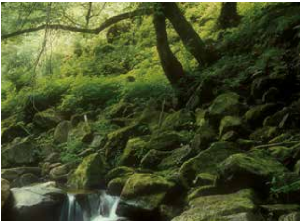
Abb. 4: Lebensraum der Alpenspitzmaus im Rannatal, OÖ.

HINTERBERGER (1858) schreibt: „ Sorex alpinus , Alpenspitzmaus, welche sich besonders in der Tannen- und Krummholz-Region aufhält, in feuchten, wasserreichen Lagen bis gegen 7.000 Fuss [= 2.134 m], ...“. Zeitlinger erwähnt in seinen Beobachtungen 1895–1935, die er in der Umgebung von Leonstein gemacht hat, ein Vorkommen in der Schmiedleiten, Pernzell aus den Jahren 1920 und 1926 (Archiv KERSCHNER). WETTSTEIN (1963) beschreibt die Art als selten, als Fundorte gibt er an: Sengsengebirge, Grünberg bei Gmunden, Laudachsee, Leonstein, Obertraun, Almsee, Grünau, Oberösterreich. Aus dem Mühlviertel war damals offenbar noch kein Nachweis bekannt.