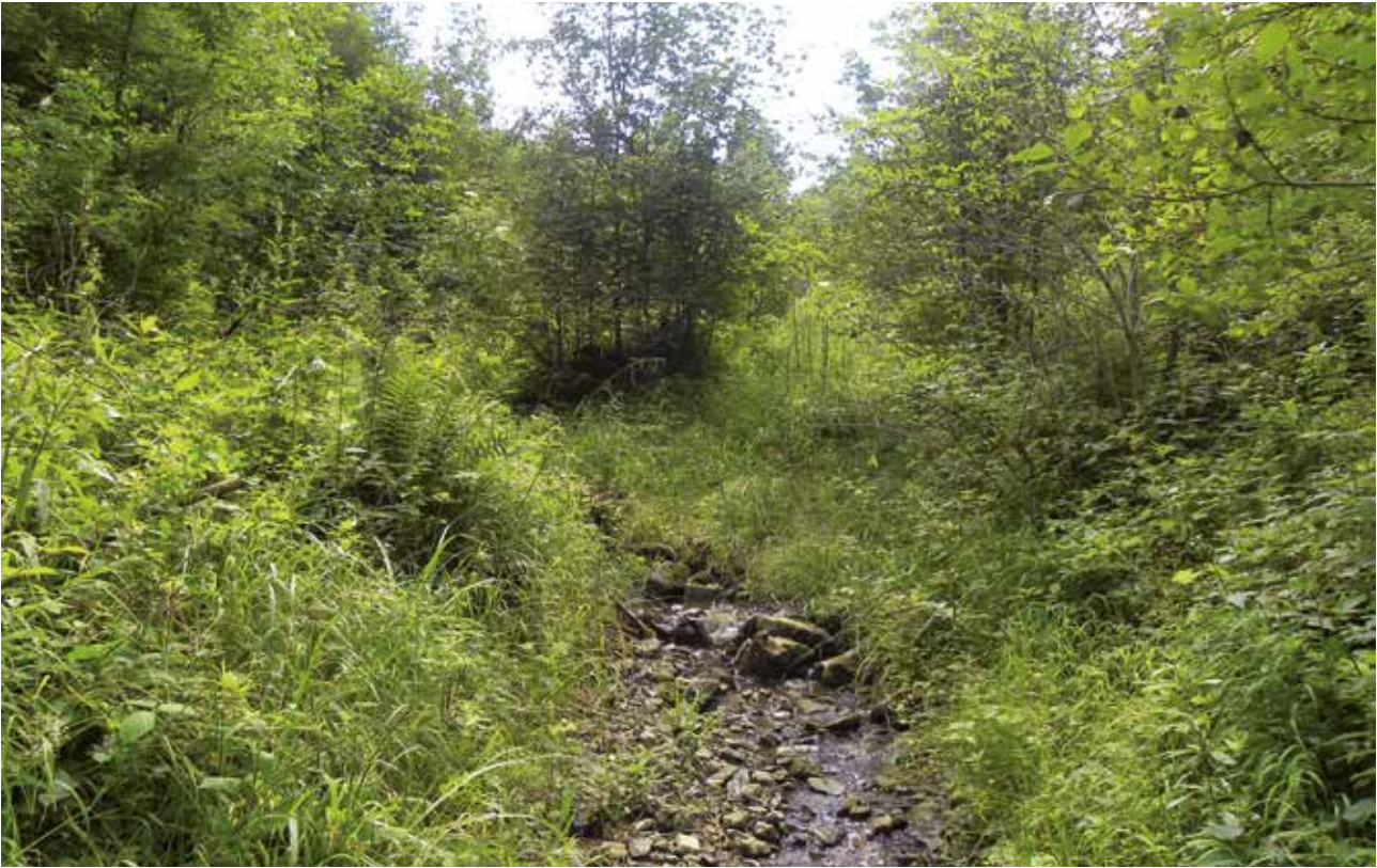
Abb. 2: Lebensraum der Alpenspitzmaus (Gmunden, OÖ).